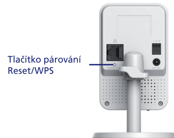
Tlačítko párování Reset/WPS

Podržte tlačítko párování Reset/WPS na dobu 15 sekund, dokud kontrolka indikace stavu nezačne svítit červeně.