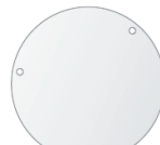
Pomocný štítek pro instalaci