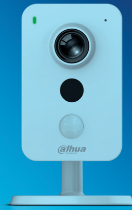
Zapojení a ovládání vnitřní kamery