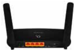
TP-Link Archer MR200 zadní strana