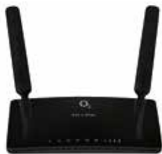
TP-Link Archer MR200 přední strana